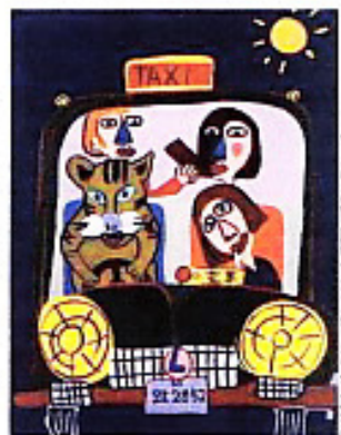
© 2009 Takeshi Kitano. "Taxi driver", 2009, 100 x 100 cm, huile sur toile

Le cinéaste japonais Takeshi Kitano, artiste contemporain à ses heures, a accepté d'être exposé à condition de pouvoir s'adresser aux enfants. Né en 1947, il a conservé l'âme d'un gamain et présente ses toiles et installations dans un pur d'attractions : machines interactives fabriquant de l'art, stand sur l'évolution des espèces, vidéos comiques, ateliers de peinture ouverts aux parents... "J'ai sans doute voulu amener une autre définition au mot art, qui soit moins officielle, moins conventionnelle, moins sué" , explique Kitano. "Gasse de peintre, Beat Takeshi Kitano". Du 11 mars au 12 septembre. Fondation Cartier, 261, bd Raspail, 75014. Tél. 01 42 18 56 77 et fondation.cartier.com